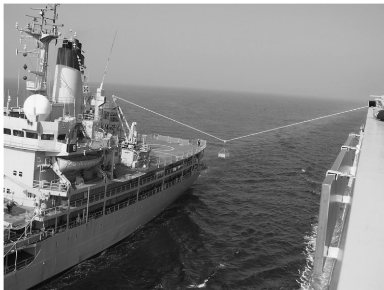
het overbrengen van voorraad

Schepen van de Koninklijke Marine worden vaak op zee bevoorrad. De afstand tussen twee varende schepen wordt constant gehouden. Vervolgens wordt een stalen kabel tussen de schepen gespannen. Met behulp van een takel worden kisten met voorraad van het ene schip naar het andere schip getrokken.